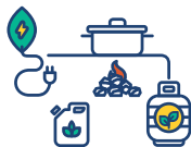
Soluções de Cozinha Melhoradas

O Programa BRILHO é um programa de 5 anos, com cobertura nacional, que catalisará o mercado fora da rede em Moçambique, promovendo e apoiando iniciativas de negócio que podem fornecer soluções energéticas limpas e acessíveis à população e às empresas, de forma competitiva e sustentável. O programa tem um mandato de apoiar as iniciativas do sector privado alavancando a sua capacidade de inovação e recursos para desenvolver e investir em soluções e serviços fora da rede; e assim melhorar a vida das pessoas de baixo rendimento através da poupança, bem-estar e oportunidades de subsistência, proporcionando, ao mesmo tempo, benefícios comerciais para o sector privado.